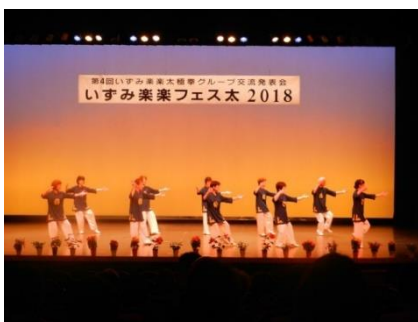
いずみ楽楽フェスタ