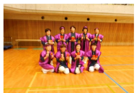
スポーツクラブ交流大会