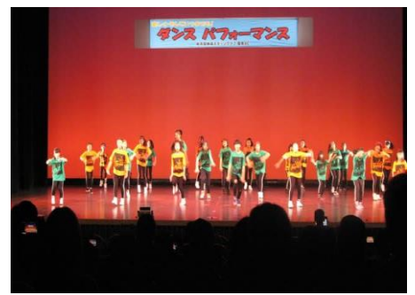
ダンスパフォーマンス 2018