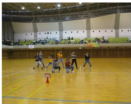
スポーツクラブ交流大会