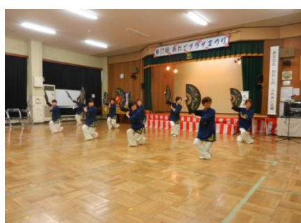
あたごプラザまつり